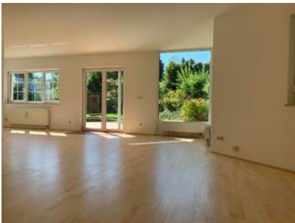
<? echo $medium['bezeichnung']; ?>