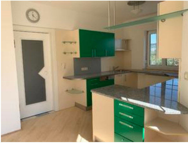
<? echo $medium['bezeichnung']; ?>