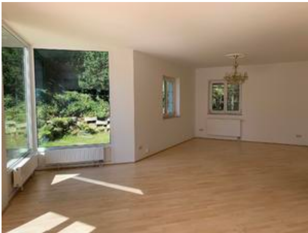
<? echo $medium['bezeichnung']; ?>