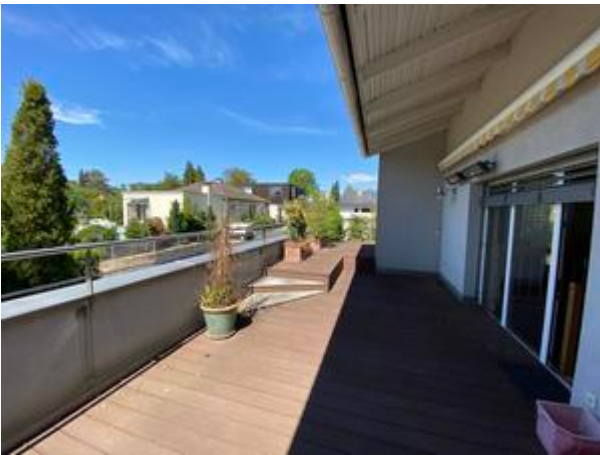
<? echo $medium['bezeichnung']; ?>