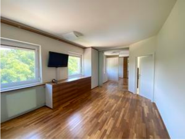
<? echo $medium['bezeichnung']; ?>