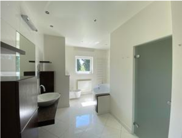
<? echo $medium['bezeichnung']; ?>