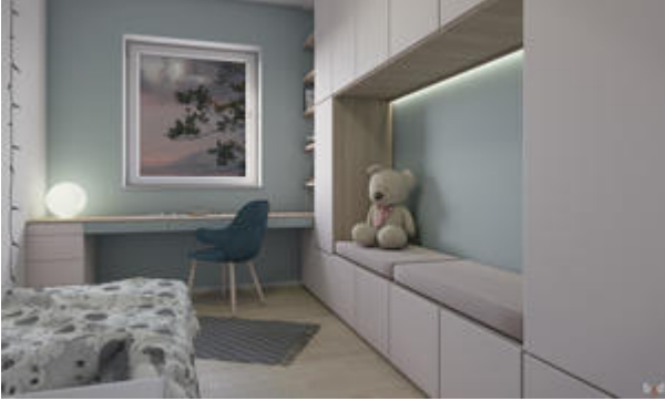
<? echo $medium['bezeichnung']; ?>