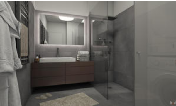
<? echo $medium['bezeichnung']; ?>