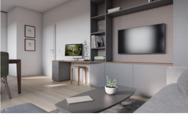
<? echo $medium['bezeichnung']; ?>