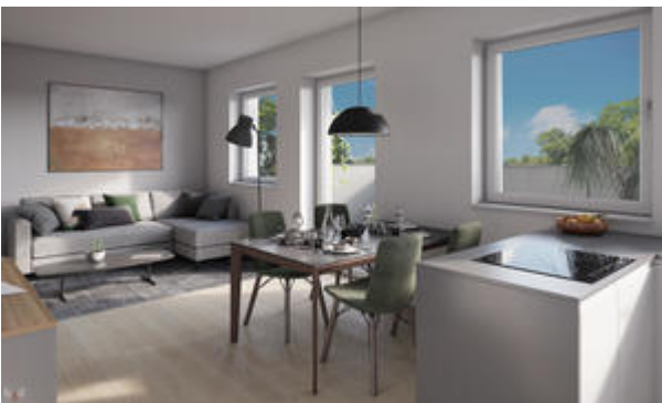
<? echo $medium['bezeichnung']; ?>