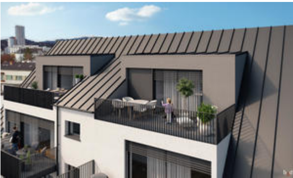
<? echo $medium['bezeichnung']; ?>