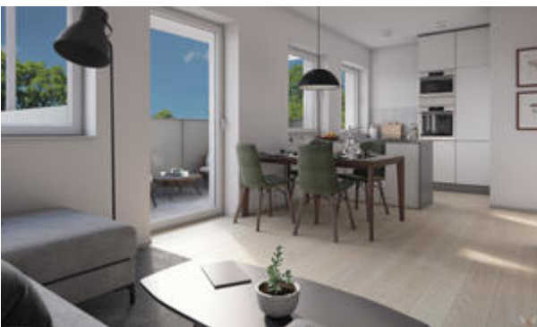
<? echo $medium['bezeichnung']; ?>