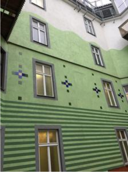
<? echo $medium['bezeichnung']; ?>