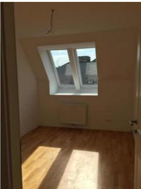
<? echo $medium['bezeichnung']; ?>