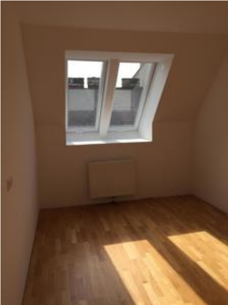
<? echo $medium['bezeichnung']; ?>