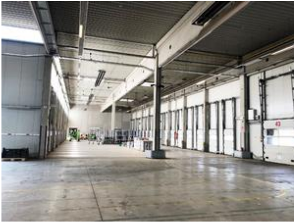
<? echo $medium['bezeichnung']; ?>