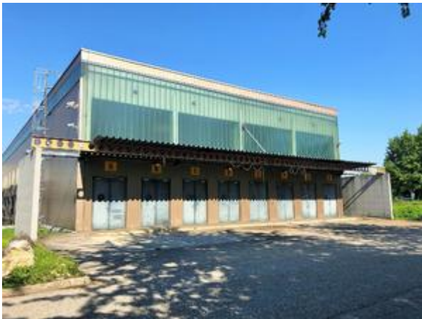
<? echo $medium['bezeichnung']; ?>