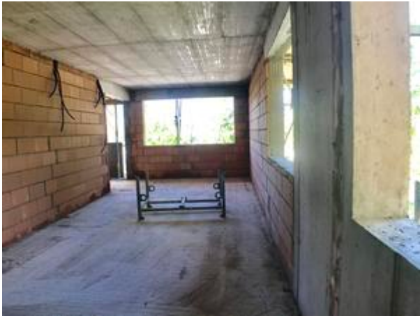
<? echo $medium['bezeichnung']; ?>