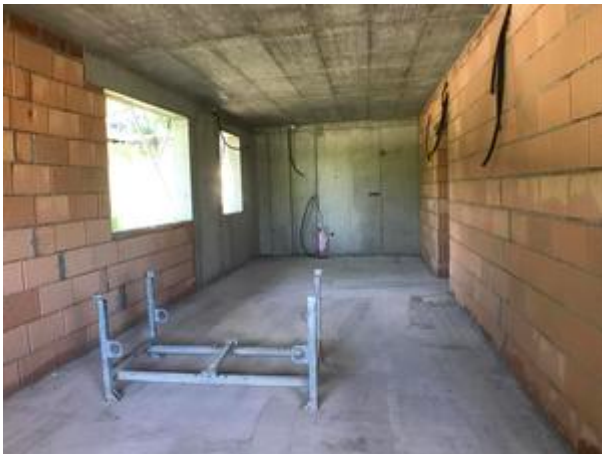
<? echo $medium['bezeichnung']; ?>