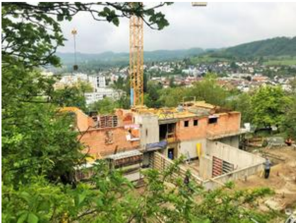
<? echo $medium['bezeichnung']; ?>