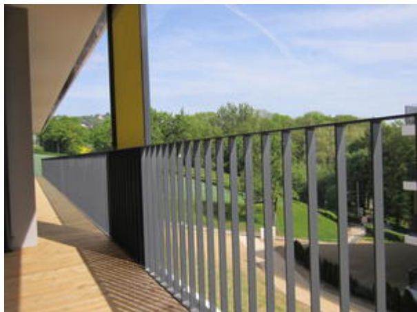
Balkon ganze Wohnung