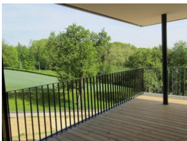
Terrasse 2 - Pöstlingbergblick - Abendsonne