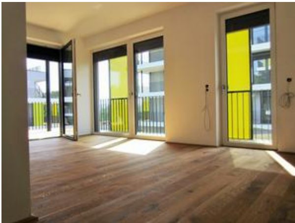
Wohnen - Essen