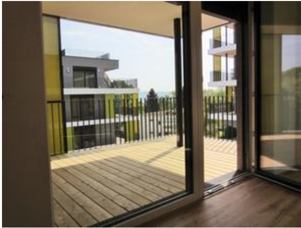
Terrasse 1 - Morgen - Nachmittagssonne