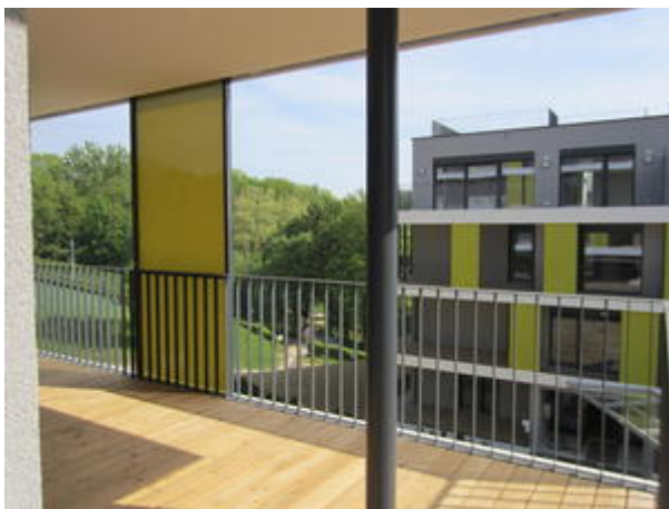
Terrasse 1 - Morgensonne