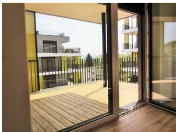
Villa 1 - Top 2 - Terrasse 1