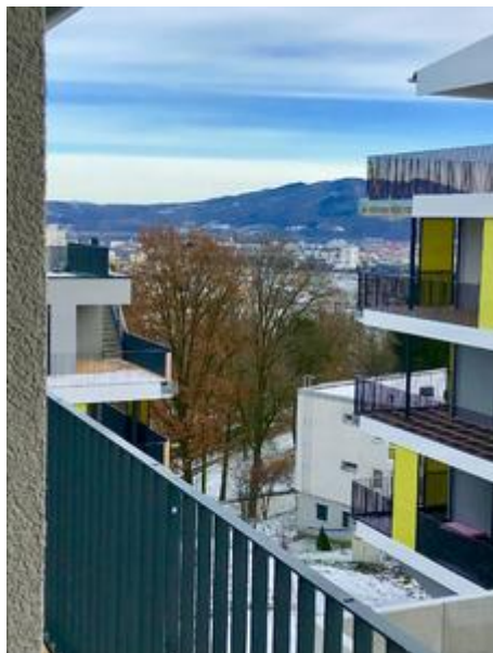
Blick von Villa 1 - Dezember 2017