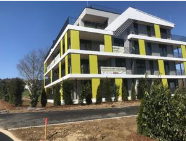
Villa 1 - April 2018