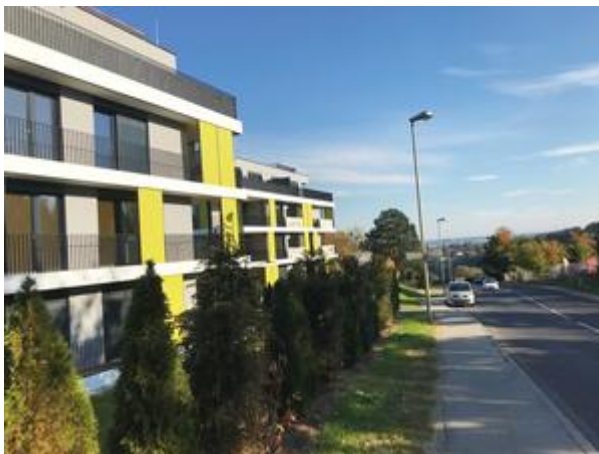
Villa 1 + 2