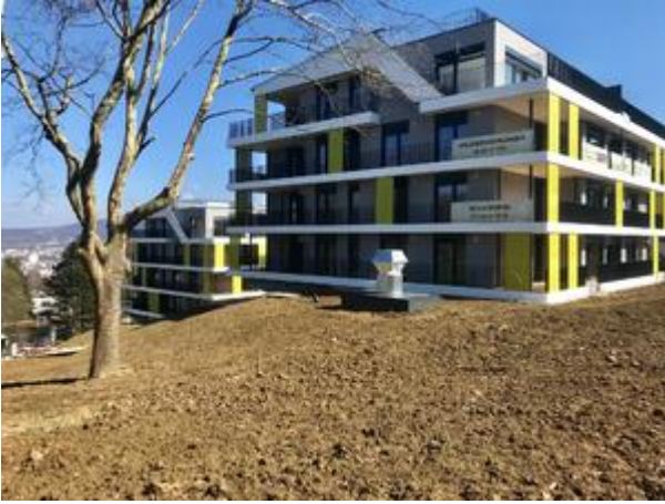
Villa 1 - April 2018