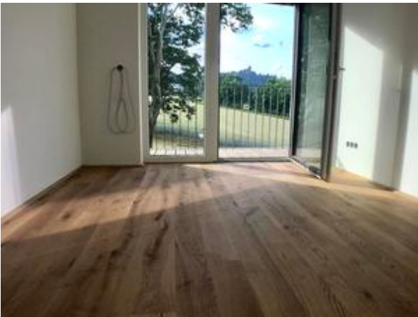
Villa 1 - Top 3 + 8