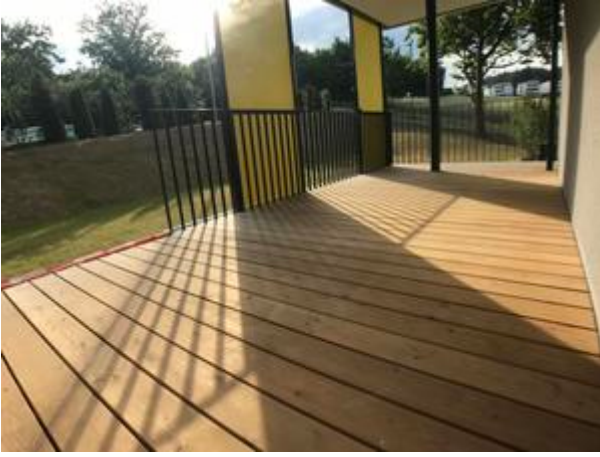
Villa 1 - Top 3 mit Garten