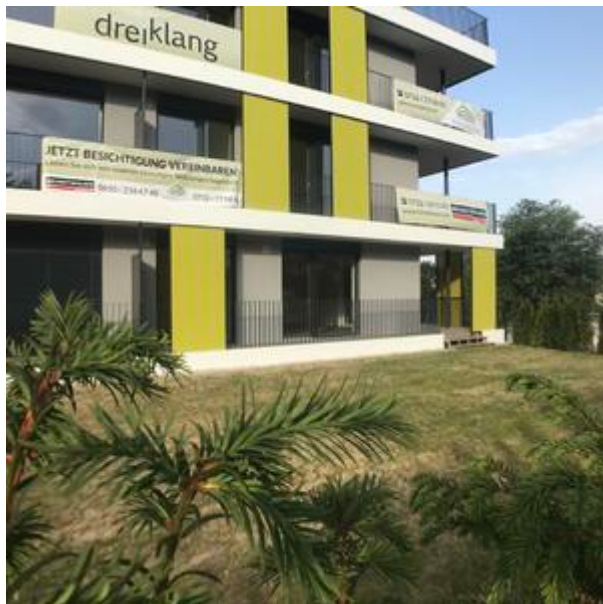
Villa 2 - Top 4 EG - Top 8 - 1.OG