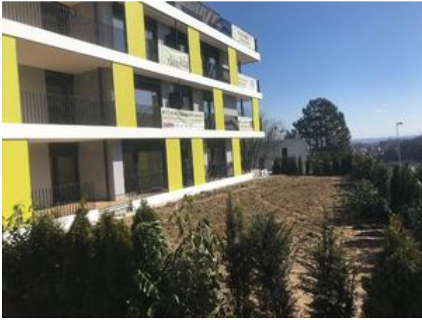
Villa 1 - April 2018