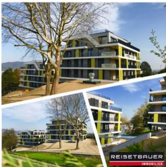
Dreiklang am Pöstlingberg