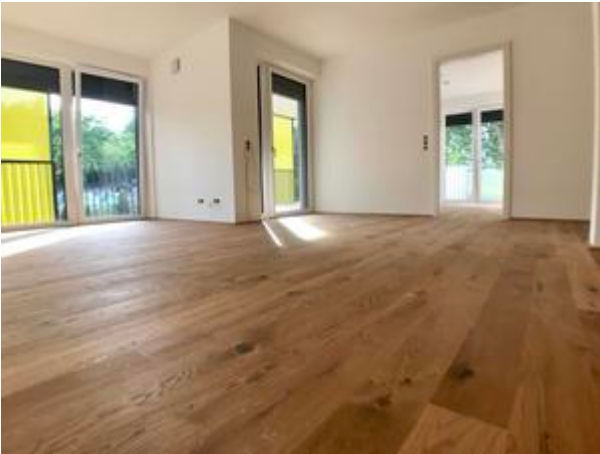
Villa 1 - Top 3 + 8