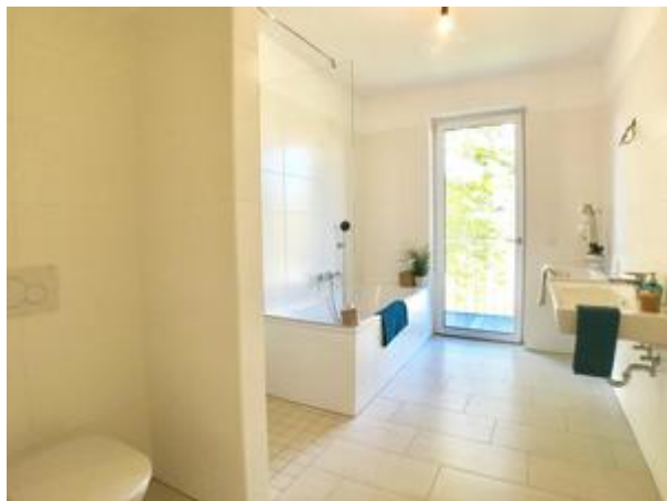
Bad mit 2. WC