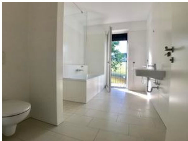
Villa 1 - Top 3 + 8