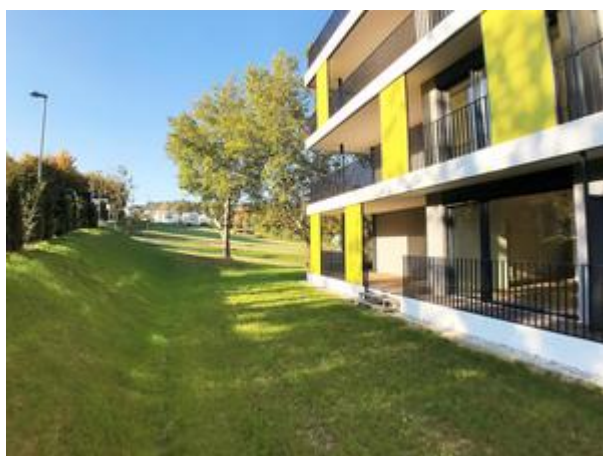
Villa 1 - Top 3 mit Garten