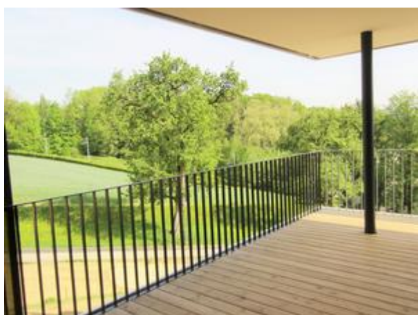
Villa 1 - Top 2 - Terrasse 2