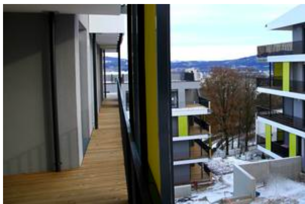
Blick von Villa 1 - Dezember 2017