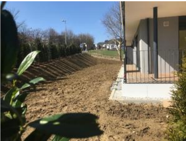
Villa 1 - April 2018