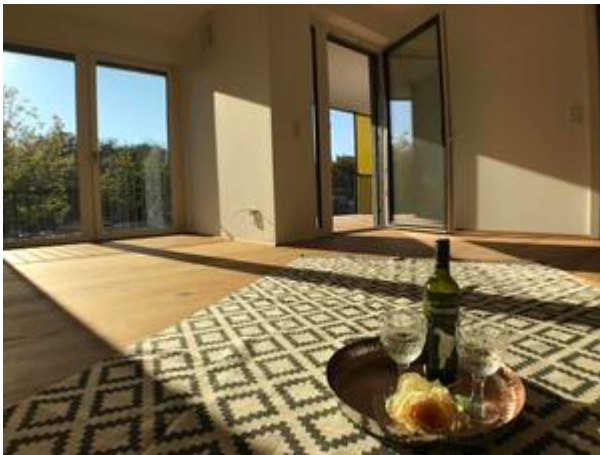
Villa 1- Top 3+8