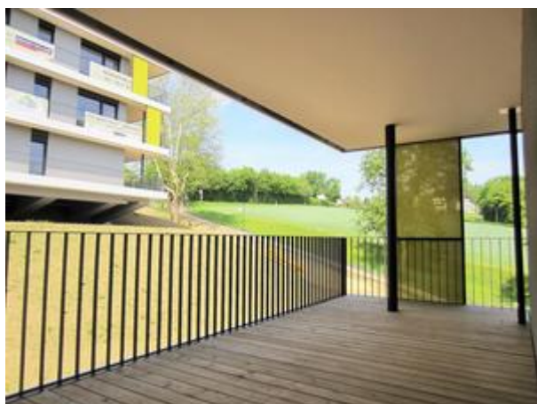
Villa 3 - Top 5 - Terrasse ca. 20m 2