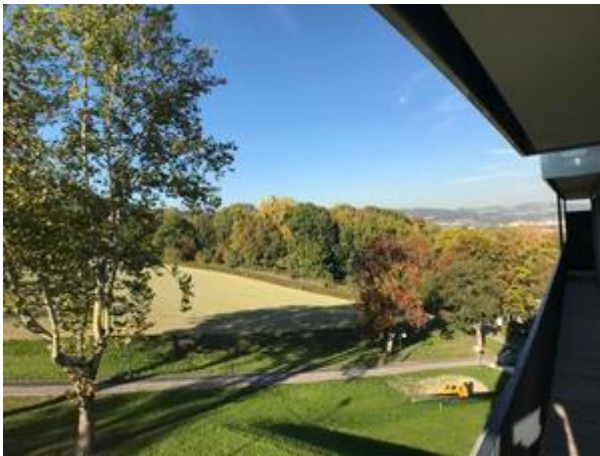
Aussicht Villa 1- Top 4+8