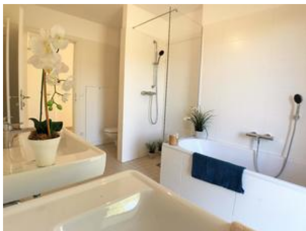
Villa 1 - Top 3+8