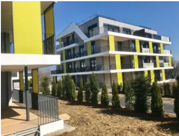
Villa 2 - April 2018