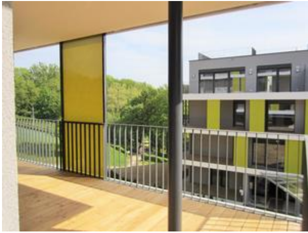
Villa 1 - Top 2