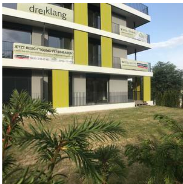
Villa 2 - Top 4 EG - Top 8 - 1.OG