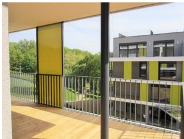
Villa 1 - Top 2