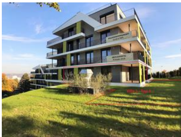
Villa 1 - Top 3 mit Garten