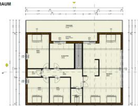
TOP 3 - DACHRAUM