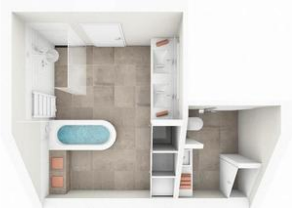
BAD - TOP 3