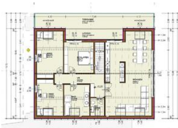
TOP 3 - DG