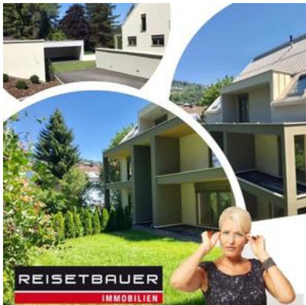
TOP 3 - DACHGESCHOSS