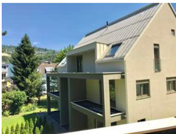
BLICK VOM PARKPLATZ